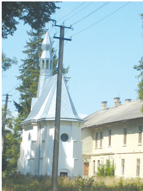
Каплиця на місці зяви Кохавинської Богородиці

Хто і коли намалював образ Кохавинської Богородиці невідомо. Він століттями був на старому дубі у кохавинському лісочку обабіч дороги, котра вела з Жидачева до Руди. У парафіяльному щоденнику Кохавинської церкви зберігся такий запис: “Цей образ намальований на дубовій дошці гарно оброблений, один лікоть ширини та один і три четвертих ліктя довжини (56/82 см). На образі зображена Пречиста Діва Марія, яка тримає на лівій руці Дитятко Ісуса, внизу напис латинською мовою “O MATER DEI ELECTA ESTO NOBIS VIA RECTA ” (“О Мати Божа, вибрана, Ти є нашою прямою дорогою <до Господа> ”). Образ від прадавніх часів знаходився при дорозі, яка проходила з м. Жидачева до м. Руди, на старому дуплавному дубі в кохавинському лісочку, біля заїзду. Цей гарний образ, як також чудове розміщення місця, привертало увагу подорожуючих та навколишніх мешканців; хто тільки проходив повз це місце, зупиняючись заносив молитву чи коротке побожне зітхання, прославляючи Царицю Неба, дивлячись на Її образ і просив Її заступництва на дальшу подорож. І Господь Бог за молитвами Пресвятої Богородиці не одного подорожнього на цьому місці вислуховував і в труднощах потішав. На жаль, невідомо хто на-