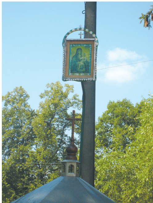
Ікона Кохавинської Богородиці