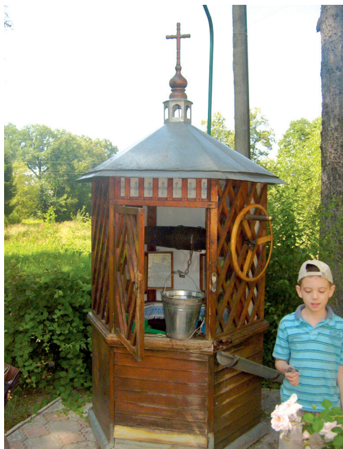
Криниця з цілющою водою у с. Руда

якому виявляється єдність віри і Церкви, незважаючи на різницю в обрядах”.