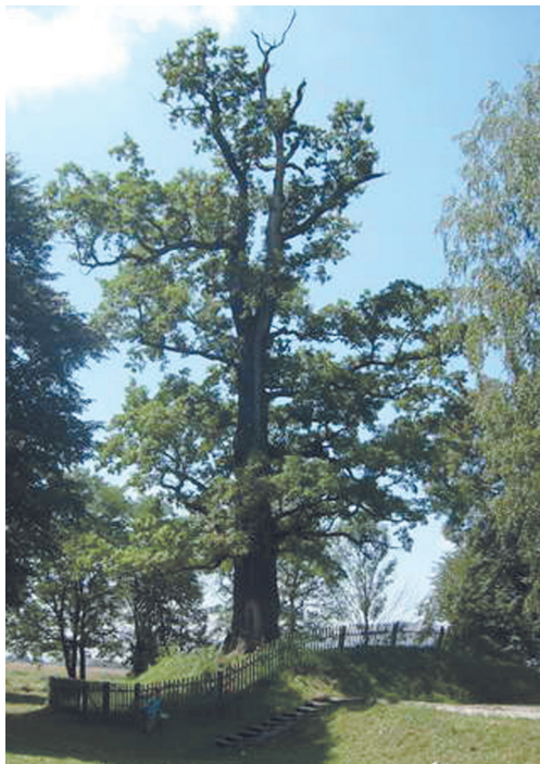
Дуб, посаджений Іваном Виговським

До речі, до садиби Виговських потраляєш лише через місточок, бо довкола маєток обнесено глибоким ровом. Щоправда, його лише умовно можна назвати гетьманською садибою. Адже ця будівля з'явилася уже після того, як Виговські продали маєток наступним господарям – графам Петруським.