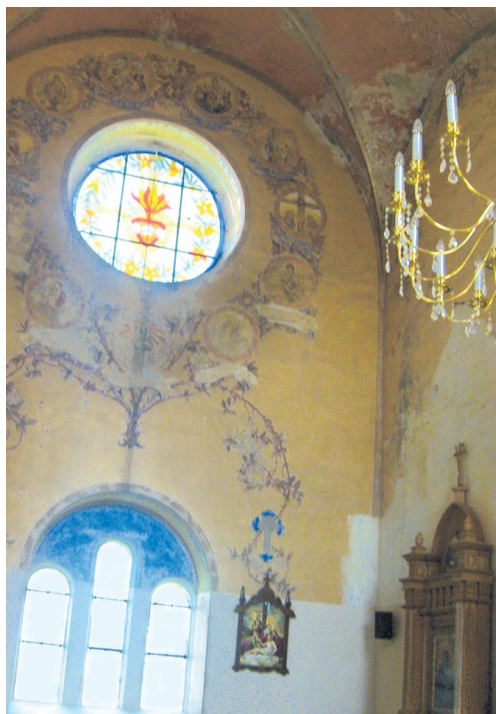
Інтер'єр храму монастиря св. Герарда

Кохавина була здавна місцем не лише паломництва, а й екуменізму. “Церковна газета” у вересні 1894 року писала: “Кохавина у надзвичайній пошані людей всіх трьох обрядів. Українців сходиться до неї найбільше, навіть більше від латинників, бувають дні в році коли прибувають також вірмени... Це одне з тих місць, в