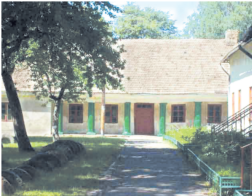
Садиба Гетьмана Виговського

За метрів сто від музею і пам'ятник видатному Гетьману. Він якраз навпроти колишнього маєтку Виговських. Нині тут ази знань здобувають місцеві дітлахи.