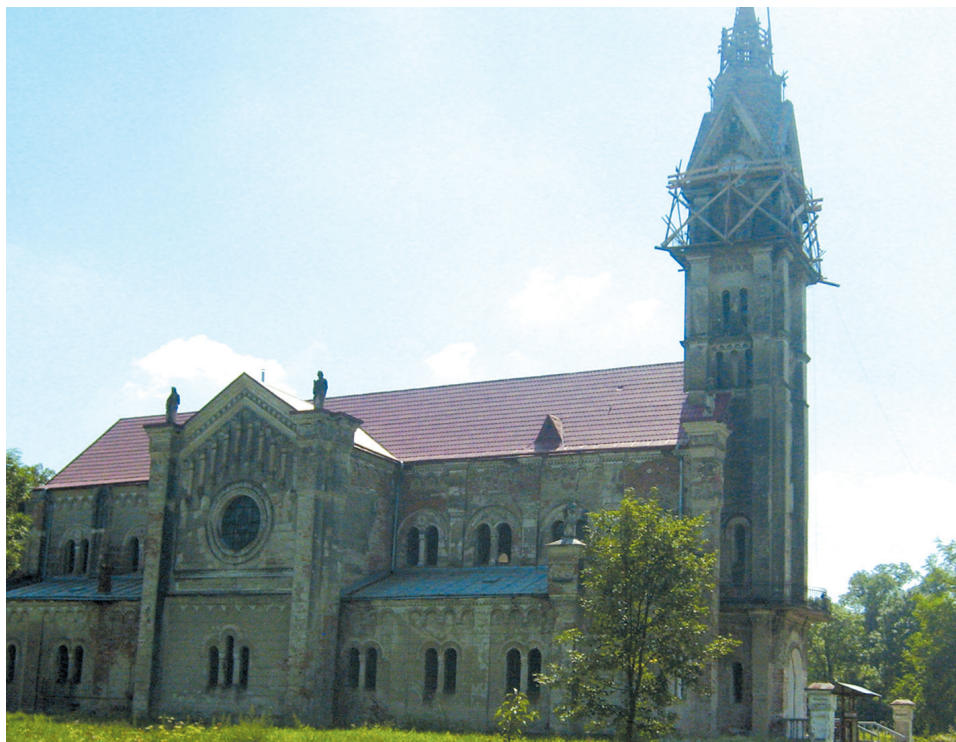
Монастир Святого Герарда.

За чотири кілометри на південь від Жидачева є невеличке село Кохавино. На жодній з карт з радянських часів цього населеного пункту віднайти неможливо: щоб стерти пам'ять людську, радянська влада приєднала його до смт. Гніздиців. А поза тим ще століття тому до Кохавинської Богородиці зі своїми молитвами і прошеннями йшли сотні тисяч прочан. Під час коронації ікони у 1912 році на цю подію лише поїздами прибуло понад 180 тисяч паломників, 100 тисяч у цей день прийняли Святе Причастя. Уже перед Другою світовою війною, починаючи з 1931 року, Кохавинськими святинями опікувалися отці Єзуїти. Саме вони, втікаючи від радянських військ до Польщі, забрали з собою і Чудотворну ікону Кохавинської Богородиці. Вона й донині зберігається у костелі міста Глівіци. У Кохавино ж – копія. Піші прощі сюди організують наразі лише з Жидачева та Стрия, а монахи поступово відроджують храм.